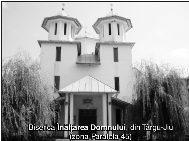
Biserica Înălțarea Domnului, din Târgu-Jiu (zona Paralela 45)

„Fericiți cei ce locuiesc în casa Ta, Doamne; în vecii vecilor Te vor lăuda”. (Psalmi, 83, 4)