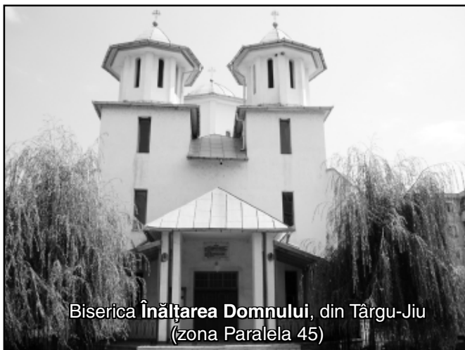
Biserica Înălțarea Domnului, din Târgu-Jiu (zona Paralela 45)

„Ferițiți cei ce locuiesc în casa Ta, Doamne; în vecii vecilor Te vor lăuda”. ( Psalmi , 83, 4)