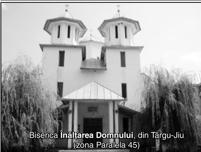
Biserica Înălțarea Domnului, din Târgu-Jiu (zona Paralela 45)

„Când îți aduci aminte de Dumnezeu, înmulțește rugăciunea, ca atunci când Îl vei uita, Domnul să-și aducă aminte de tine.” (Sfântul Marcu Ascetul – Filocalia I)