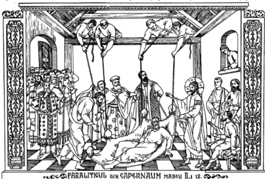
PARALITICUL DIN CAPERNAUM MARCU II, 1-12

și, înainte de a muri, o mustră pe Kalloni, care îl îndemna să-și încredințeze copiii în grija împăratului Andronic al II-lea Paleologul (1282-1328), spunându-i că îi lasă în seama Maicii Domnului, la care avea evlavie fierbinte: „Eu nu-mi voi lăsa copiii împăraților pământești și parțiali, ci Augustei Stăpâne a toate, Mamei Împăratului cerurilor, a zis el, privind spre icoana Maicii lui Dumnezeu care îi stătea înaintea ochilor.” Deși a primit o solidă educație literară și filozofică, refuză oferta de a rămâne la curtea împăratului, fiind atras de viața de asceză și inițiat în rugăciunea isihastă de Teofil, mitropolitul Filadelfiei. La 20 de ani se hotărăște să intre în mănăstire, determinând la aceasta întreaga familie: mama, frații și surorile. Împreună cu cei doi frați pleacă la muntele Athos, unde petrece 20 de ani. Sf. Grigorie îmbină o asceză riguroasă cu o participare