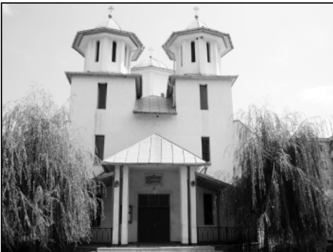
Biserica Înălțarea Domnului, din Târgu-Jiu (zona Paralela 45)